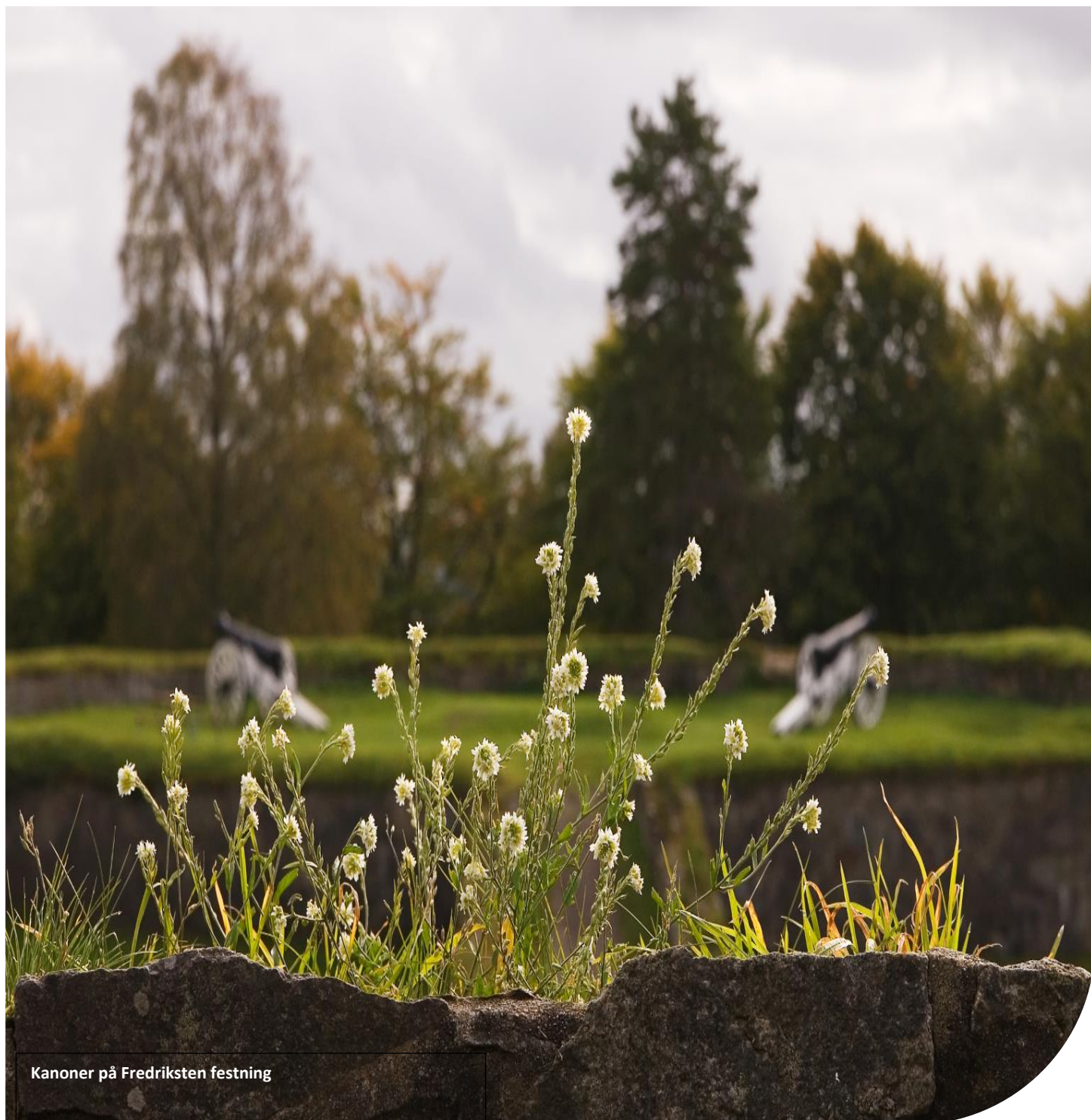
Kanoner på Fredriksten festning